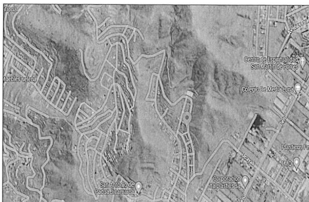
Imagen 1: Ubicación del proyecto en el Distrito de San Juan de Lurigancho.