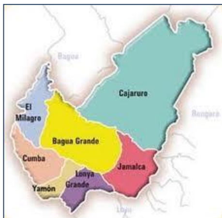
Gráfico N° 02 PROVINCIA DE UTCUBAMBA

En el gráfico se muestra la localización del distrito Bagua grande del mapa de la provincia de Utcubamba, cuyos distritos limítrofes y vecinos son El Milagro, Cajaruro, Lonya Grande, Yamón y Cumba.