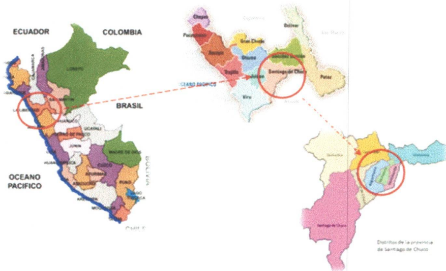
Figura2. Mapa de la Provincia de Santiago de Chuco