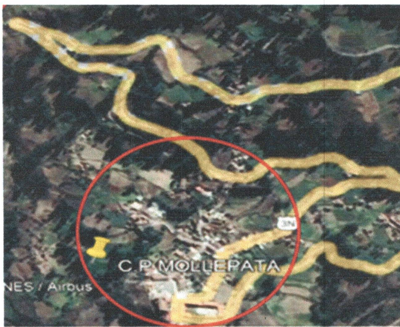
Figura 3. Ubicación del proyecto

“Año del Bicentenario, de la consolidación de nuestra Independencia, y de la conmemoración de las heroicas batallas de Junín y Ayacucho”