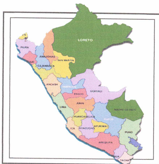
Gráfico N° 2

LOCALIZACIÓN GEOGRÁFICA DE LA PROVINCIA DE CHEPEN – LA LIBERTAD