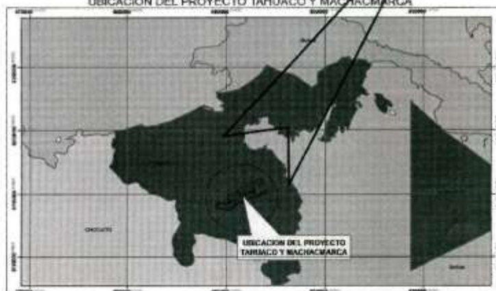
UBICACION DEL PROYECTO TAHUACO Y MACHACMARCA