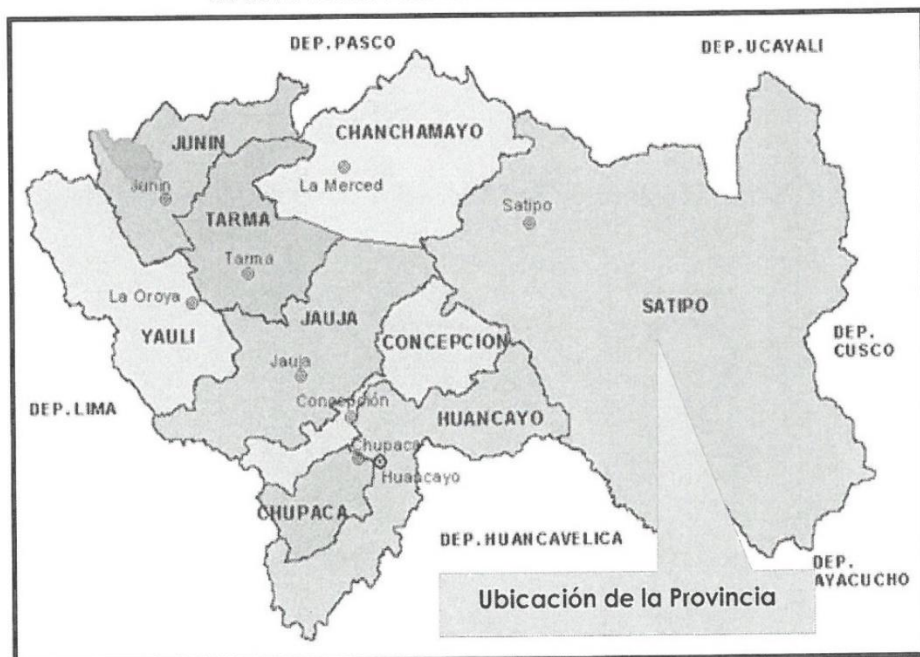
MAPA DEL DEPARTAMENTO DE JUNIN