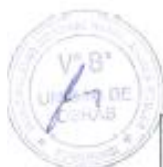
CUADRO DE PENALIDADES

Asimismo, la ENTIDAD ha considera la aplicación de otras penalidades según lo establece el Artículo 163 del Reglamento de la Ley de Contrataciones del Estado, se describen en la siguiente tabla: