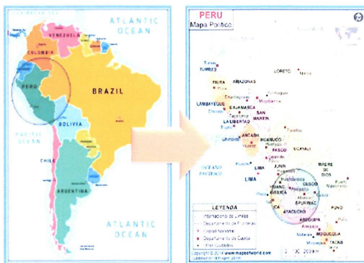
FIGURA N° 01 - MAPA DE UBICACIÓN MACRO