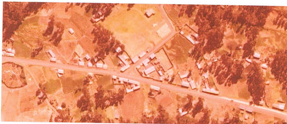
Mapa de Ubicación del centro poblado Auquimarca