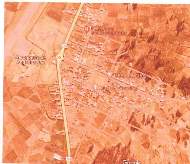
Mapa de Ubicación del centro poblado Huinchos