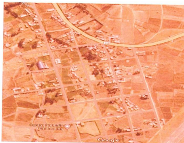
Mapa de Ubicación del centro poblado Pataccocha

La prestación será en la zona urbana del distrito de José María Arguedas, PROVINCIA DE ANDAHUAYLAS, DEPARTAMENTO DE APURÍMAC.