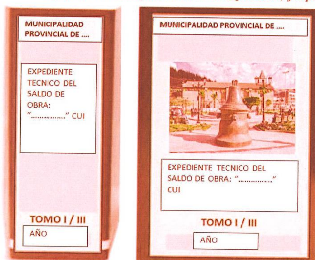
Figura 1. Forma de presentación del Expediente (ejemplo)

Cuando el expediente técnico de saldo de obra, fuera aprobado por el ministerio de vivienda, en su totalidad, ya debera presentado en archivadores. Cada archivador deberá considerar una carátula en la parte frontal y en lomo del mismo, para una rápida verificación. Se recomienda que dichas carátulas, deberán indicar como mínimo, lo indicado en la figura 1 (ejemplo modelo).