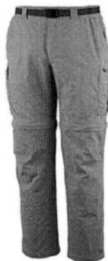
Pantalón de Campo con saca pierna Foto Referencial