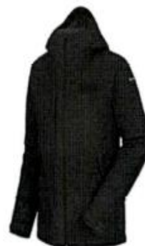
Casaca Impermeable Foto referencial