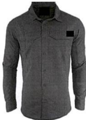
Camisa de Campo manga larga para trekking (secado rápido) Foto Referencial