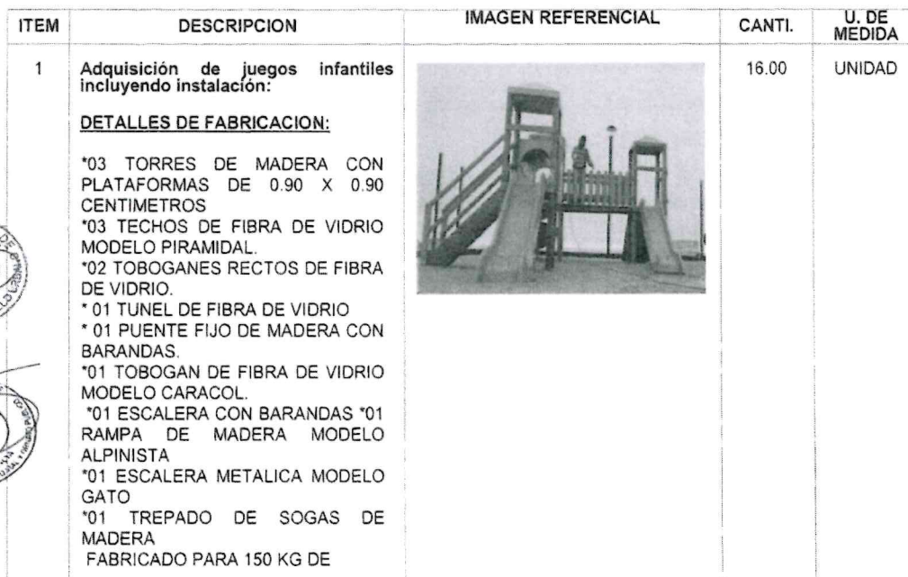
Cuadro N° 01