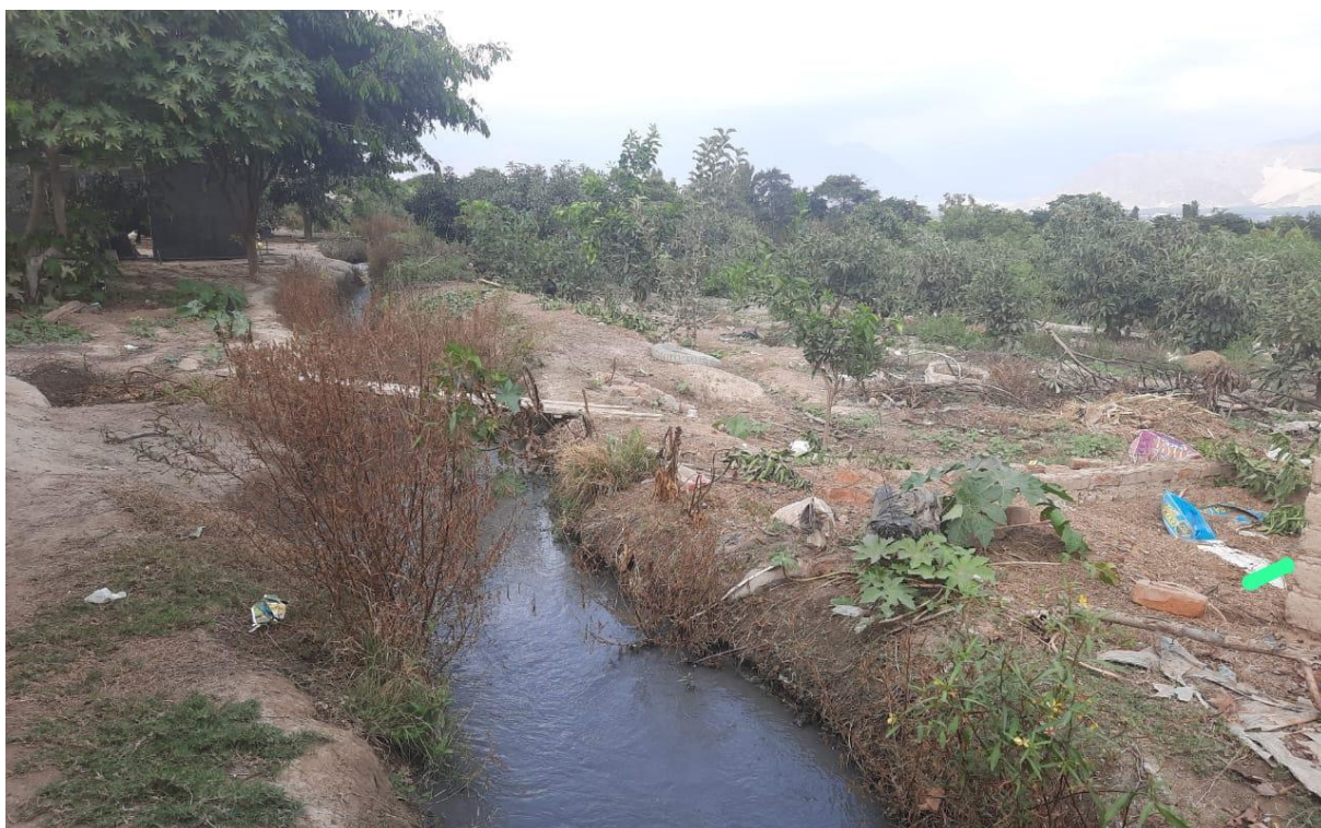
Figura N°8: Situación actual de la estructura del Canal Buena Vista.