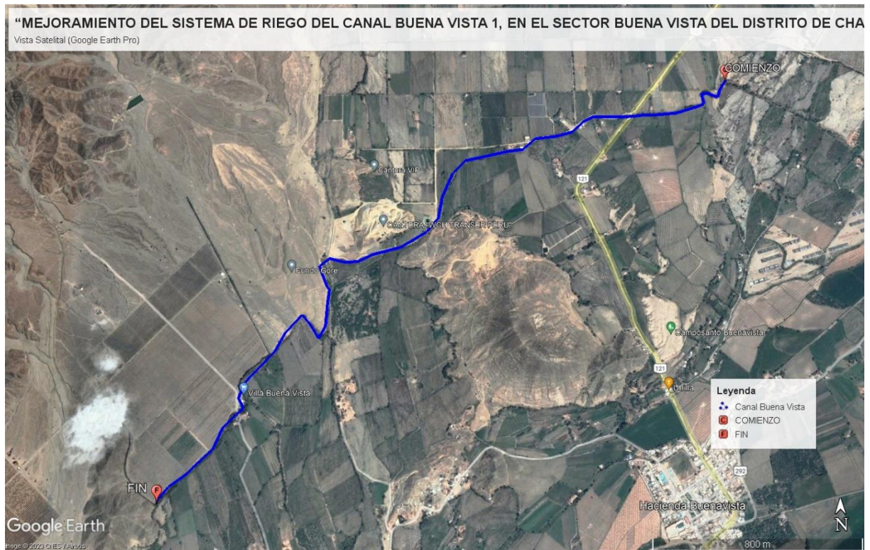
Figura N° 3: Esquema de Ubicación General