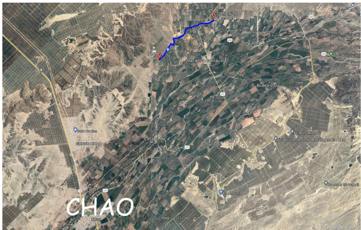
Figura N° 4: Esquema de Ubicación y Acceso a la zona a intervenir, desde Punto de Referencia (Centro del Distrito - Chao).