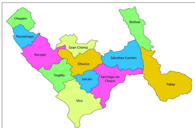
Figura N°01: Ubicación de la provincia de Viru