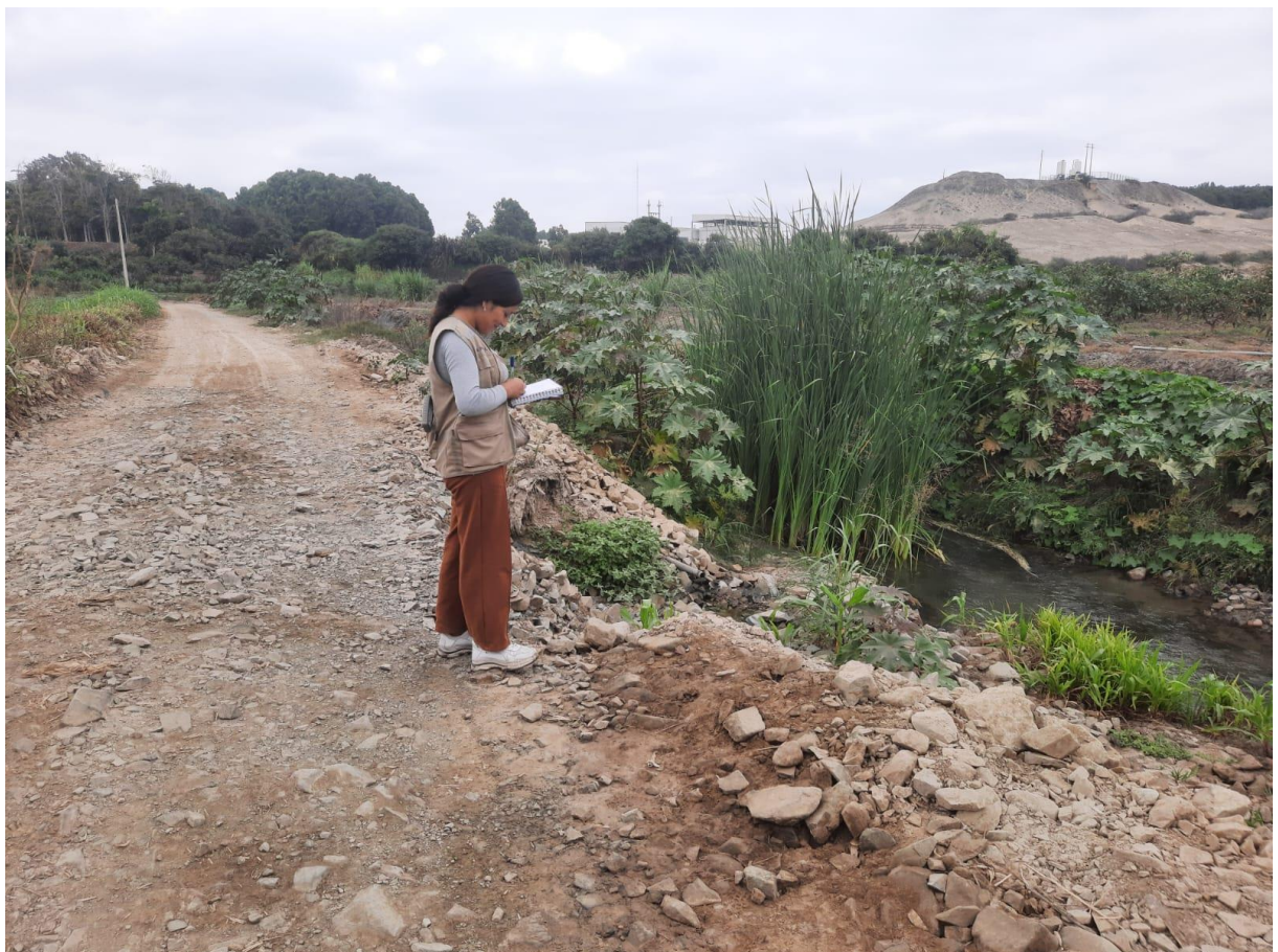
Figura N°6: Situación actual del Canal Buena Vista.

El Sistema de Riego Buena Vista presenta graves problemas técnicos, deficiencias para abastecer un determinado área de riego, ello debido al fenómeno del niño , que acabo por colapsar la estructura construida por la junta de usuarios del distrito de Chao, actualmente el área bajo riego de esta canal son aproximadamente 1,336.64 Ha, el beneficia a 20 usuarios y por el cual a su vez circula un caudal de operación 350 l/s. Sistema de Riego Buena Vista es beneficiado por el rio Chorobal y tiene una longitud de 1,076 m, entre la gama de productos que se producen están la alcachofa, alfalfa, arándano, caña de azúcar, cebolla, chí, hortalizas entre otros productos los cuales son sustento de estas personas y que se ven afectados por la baja calidad de distribución de agua y abastecimiento.