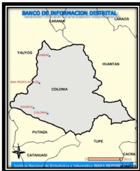
Distrito de Colonia