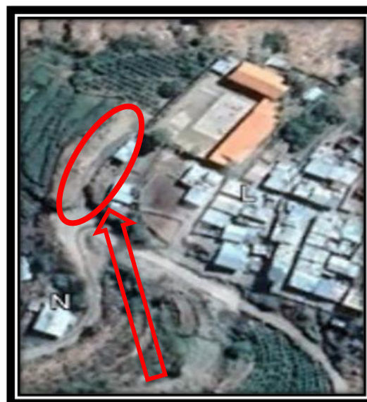
Ubicación del proyecto a ejecutar de la I.E.I N°422