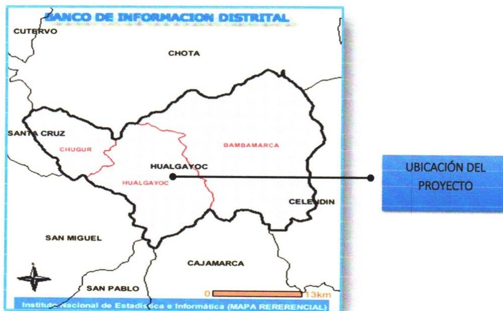
Gráfico N° 03 – Ubicación del Proyecto: San José del Cumbe