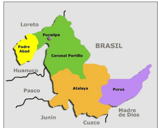
Mapa macro localización del departamento de Ucayali