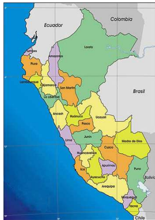
Mapa de macro localización del Perú