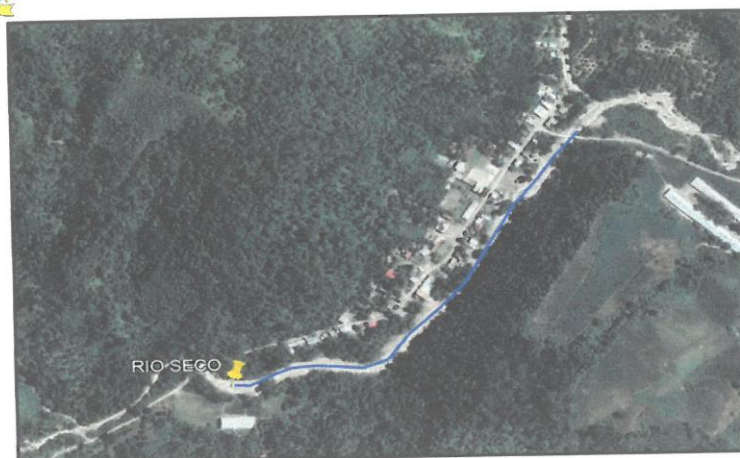
CROQUIS DEL TRAMO A INTERVENIR