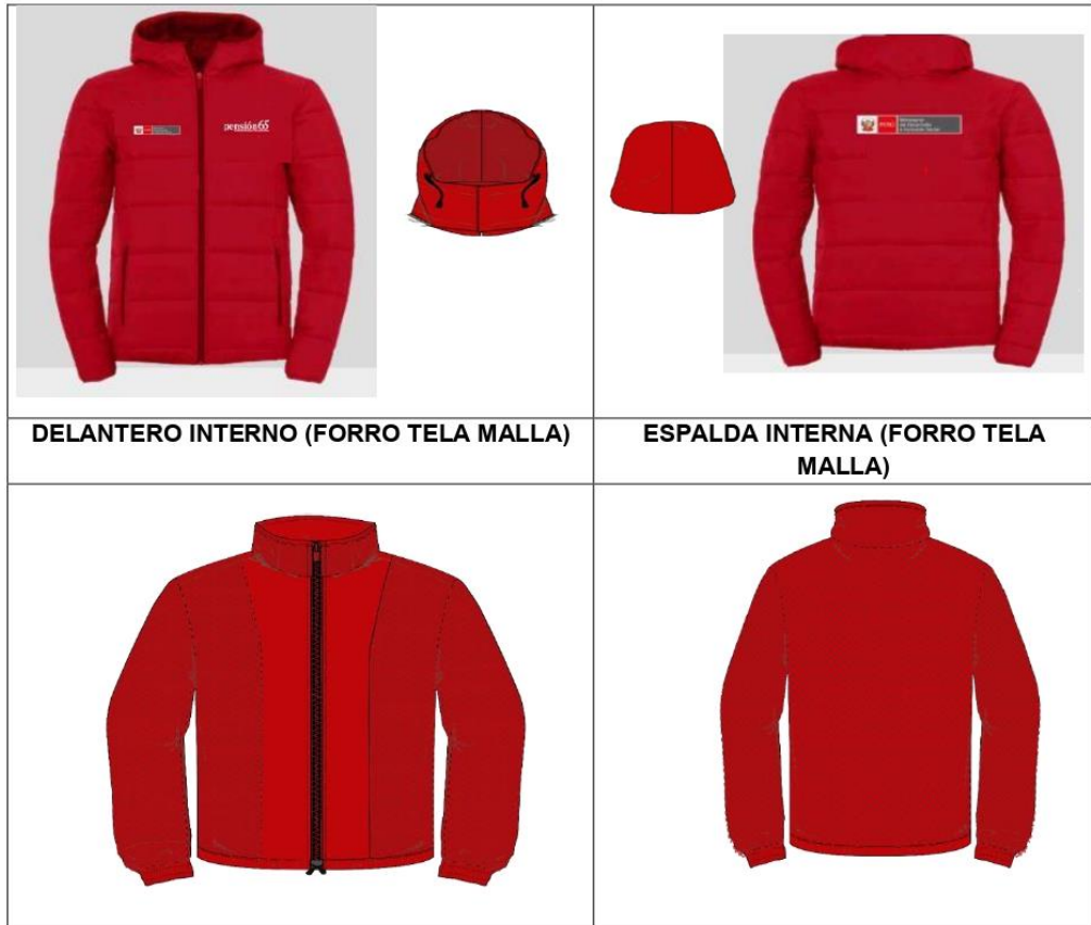
DELANTERO INTERNO (FORRO TELA MALLA)

Decenio de la Igualdad de Oportunidades para Mujeres y Hombres" "Año del bicentenario, de la consolidación de nuestra independencia y de la conmemoración de las heroicas batallas de Junín y Ayacucho"