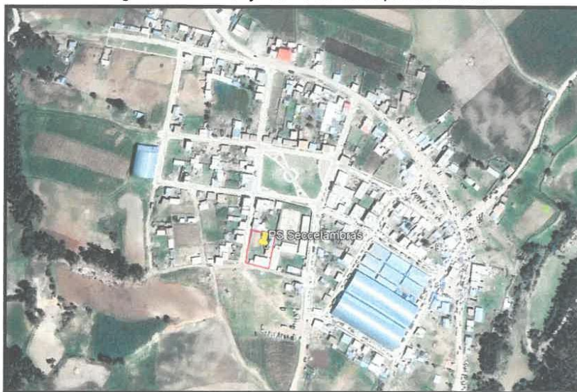
Imagen N°02 Ubicación y Localización de los puestos de salud