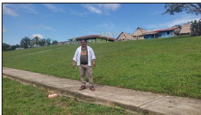
FOTOS: Comunidad de Lagarto Cocha.

Se encuentra a una altitud promedio de 117 msnm a 110 msnm, cuyo terreno natural presenta un relieve semiplano, pendientes relativamente pronunciadas que van del orden del 0.5% al 2%. (VER PLANO PLANTA TOPOGRAFICA). BM adoptado para el proyecto han sido determinados en base a la Cota de Máxima Inundación (año 2012 = 98.00 msnm) proporcionado por la Marina de Guerra del Perú. El clima de la localidad es tropical, cálido y lluvioso, con temperatura máxima media anual entre 30.5° y 31.0 °C y temperatura mínima media anual entre 21.0° y 21.5°C.