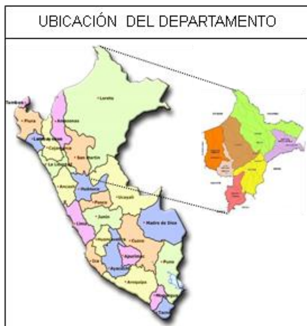
Imagen N°01: Marco de localización

IE BONIFACIO ALVARADO PAREDES - YURIMAGUAS DISTRITO DE YURIMAGUAS, PROVINCIA ALTO AMAZONAS, DEPARTAMENTO LORETO