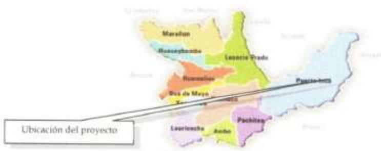
MAPA POLÍTICO YUYAPICHIS