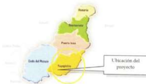
MAPA POLÍTICO YUYAPICHIS