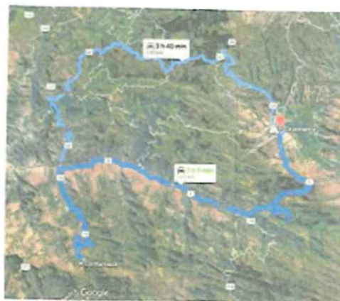
Ilustración 6: Ruta B Cajamarca - Contumazá