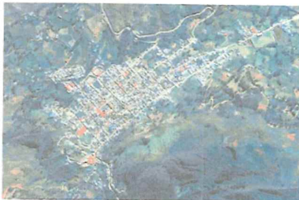
Ilustración 4: Distrito de Contumazá