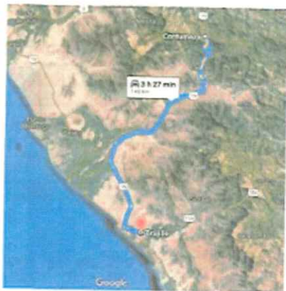
Ilustración 5: Ruta A Trujillo - Contumazá