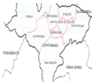
Ilustración 3: Mapa de la provincia de Contumazá