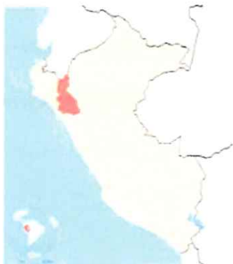
Ilustración 1: Mapa macro de la localización del Perú