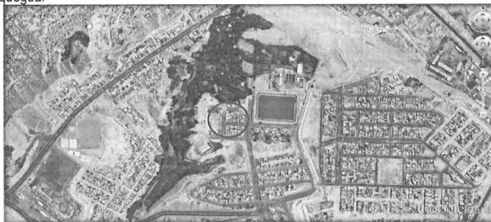
(Imagen Satelital de la ubicación del Proyecto)