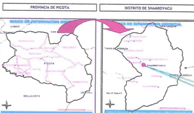
MAPA DE IDENTIFICACION DE LA UNIDAD PRODUCTORA