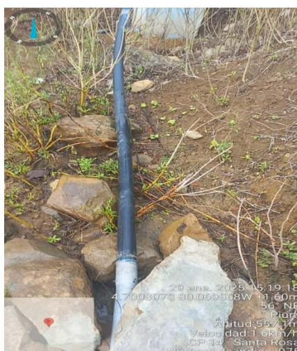
Captación del líquido elemento, línea de conducción