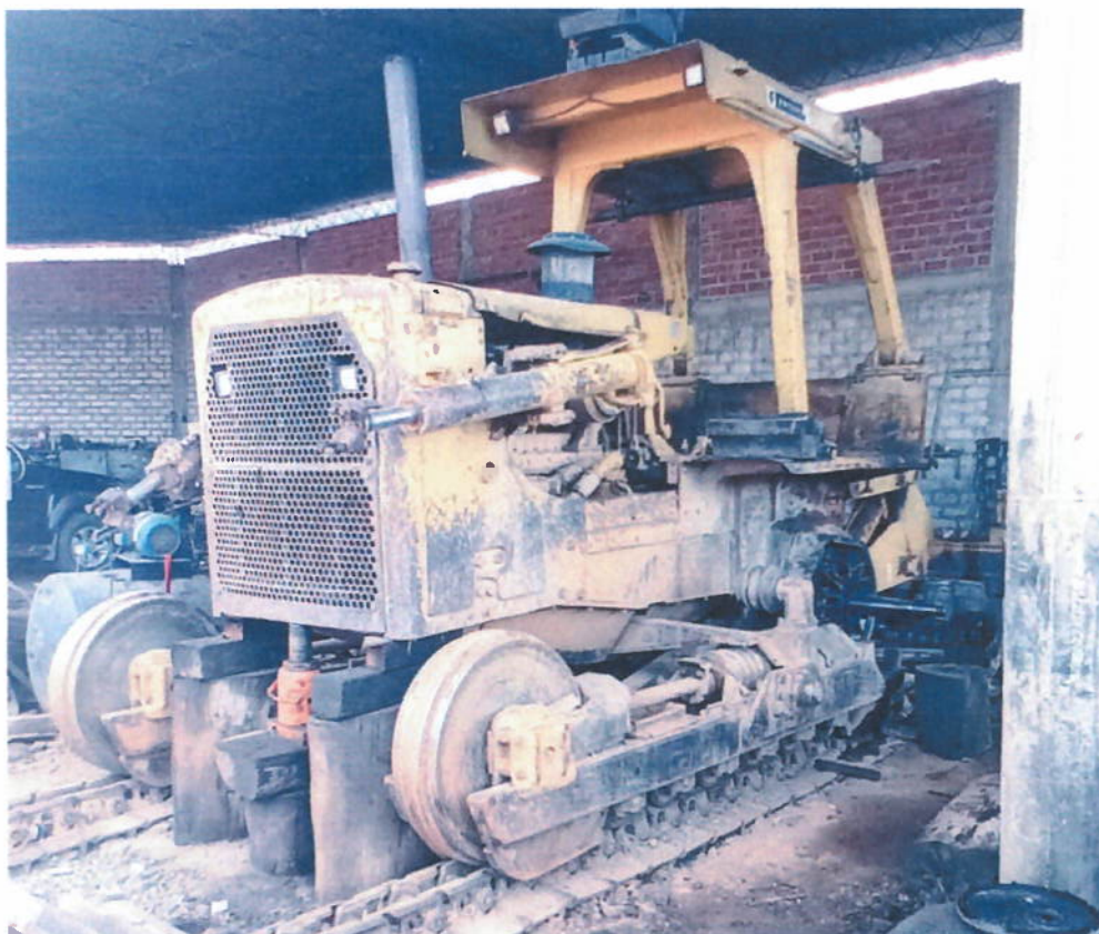
Piñón De Mando Roto