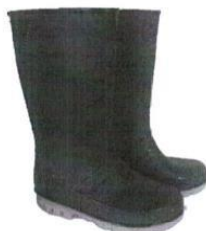
Botas de Jebe