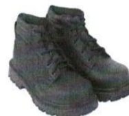
Zapatos de Seguridad con Puntera de Acero