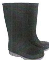
Botas de Jefe