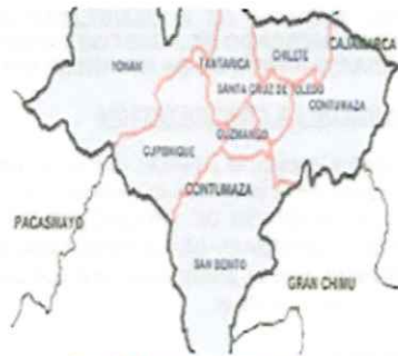
Ilustración 3: Mapa de la provincia de Contumazá