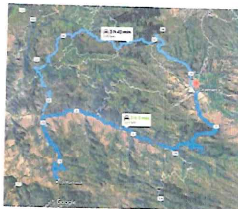
Ilustración 6: Ruta B Cajamarca - Contumaza