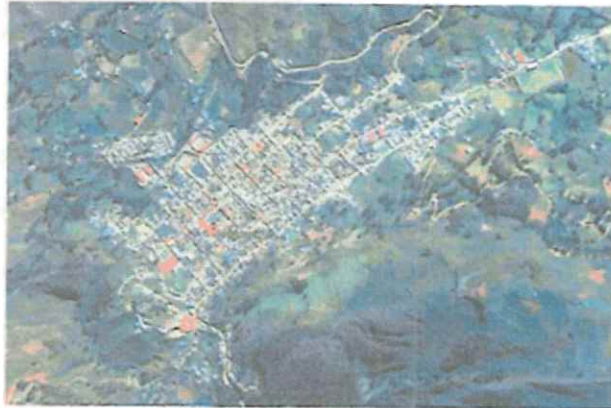
Ubicación distrito de Contumazá