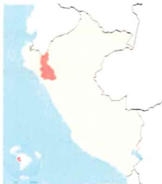
Ilustración 1: Mapa macro de la localización del Perú