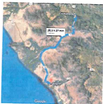
Ilustración 5: Ruta A Trujillo - Contumaza