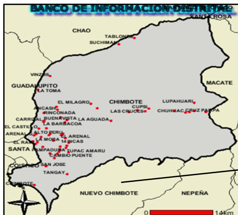
PROV. DEL SANTA