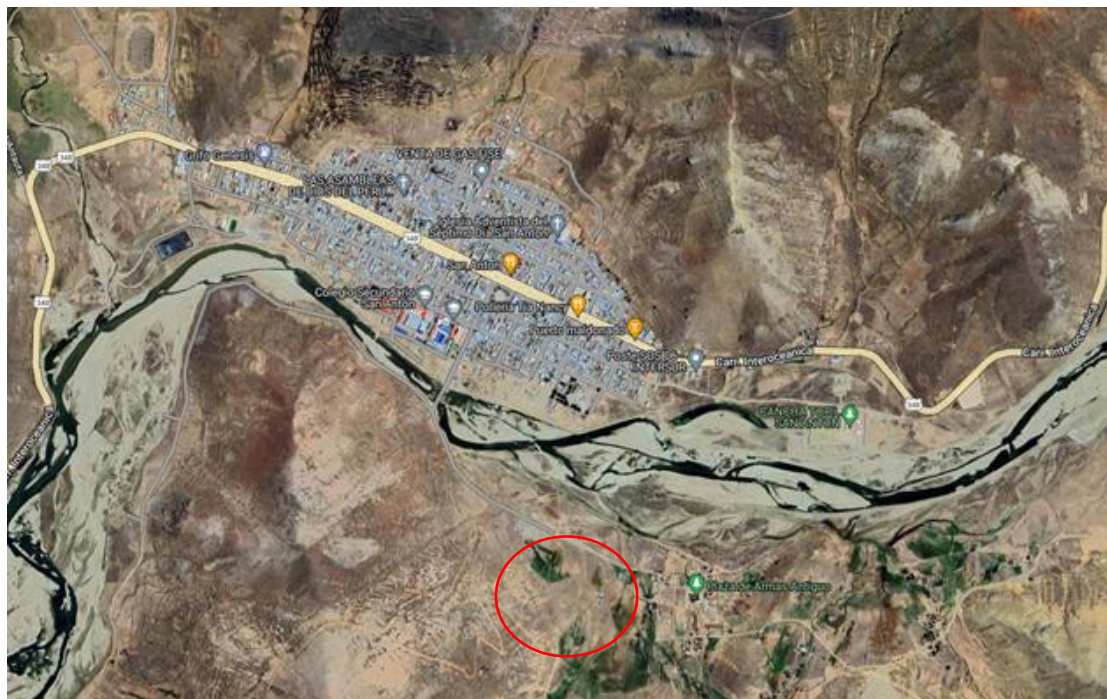
EL CENTRO POBLADO DE SAN ANTON Y PUEBLO ANTIGUO