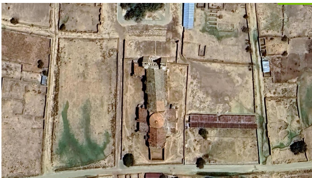
VISTA AEREA DE LA CUBIERTA DEL TEMPLO DE FORMA DE CRUZ LATINA

Por lo que es menester y de importancia vital, la realización y elaboración de estudios y proyectos de carácter multidisciplinario y de especialidad, para la recuperación del patrimonio del pueblo material e inmaterial y de sus costumbres como parte de su propia identidad y cultura.