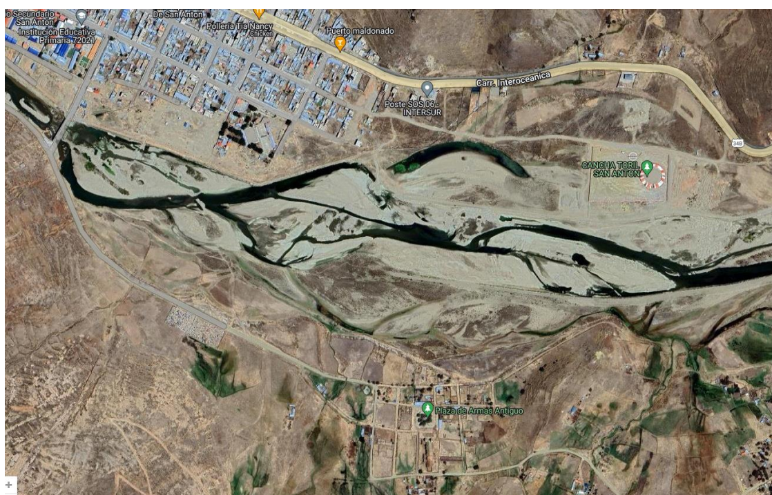
EL TEMPLO Y SU UBICACIÓN CON RESPECTO AL POBLADO NUEVO