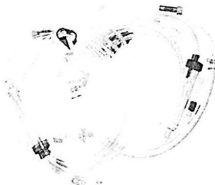
Fig 1.: Set de Línea arteriovenosa para hemodiálisis (no incluye diseño)