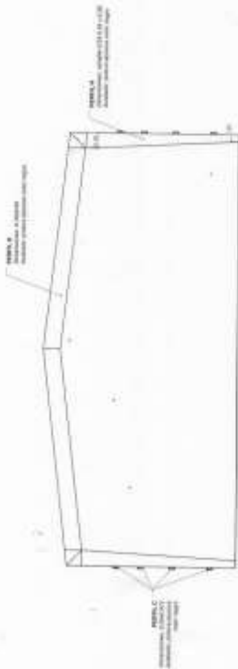
ELEVACION ESTRUCTURA DE HANGAR FOLIO 1/1