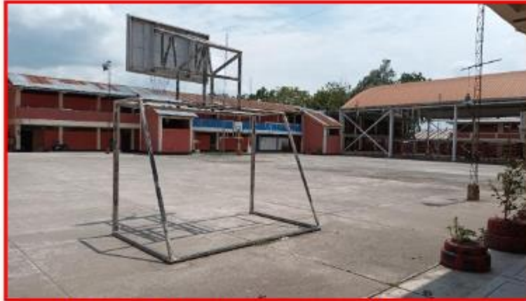
Imagen 2 – Área para la construcción de techado cobertura metálica liviano de la I.I.EE Carlos Wiese.