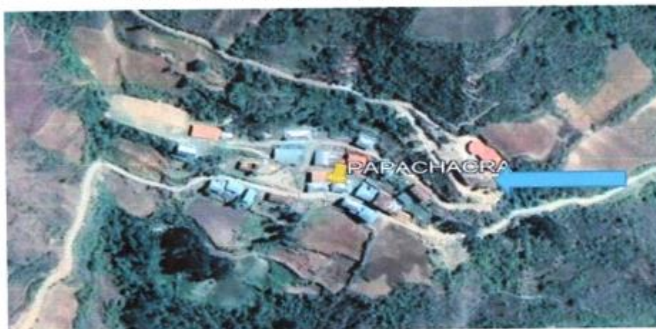
Ubicación Geográfica del lugar donde se proyecta la edificación.

"CREACIÓN DE LOS SERVICIOS OPERATIVOS O MISIONALES INSTITUCIONALES EN EL Y/O CENTRO POBLADO PAPACHACRA DISTRITO DE CHILLIA DE LA PROVINCIA DE PATAZ DEL DEPARTAMENTO DE LA LIBERTAD" CON CUI N° 2593048.