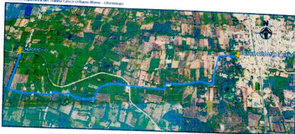
IMAGEN N°01. TRAZO DEL TRAMO CASCO URBANO ILLIMO - CHIRIMOYO

Ubicación específica del Tramo Casco Urbano Illimo - Chirimoyo