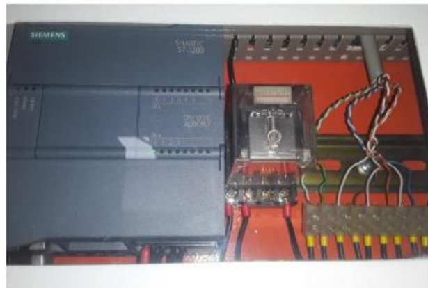
PLC instalado en el Tablero de monitoreo remoto