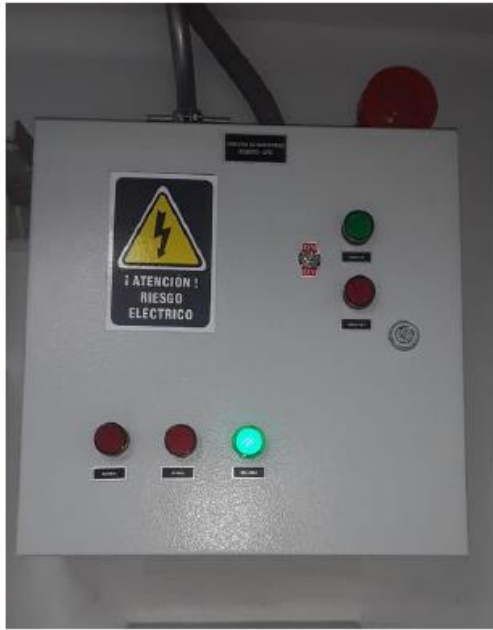
Tablero de monitoreo remoto en el Centro de datos – 4to piso