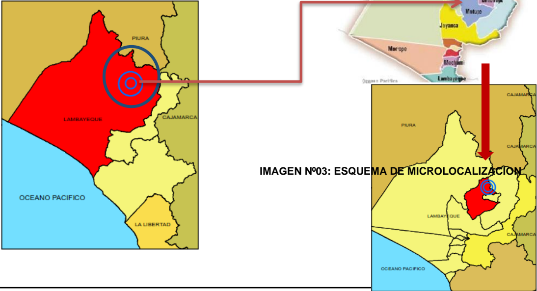
IMAGEN Nº03: ESQUEMA DE MICROLOCALIZACIÓN