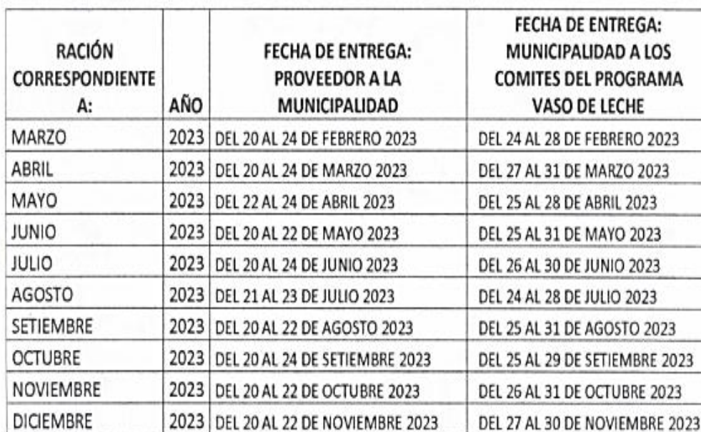
Cuadro 02: CRONOGRAMA DE ENTREGA DE LECHE EVAPORADA ENTERA EN TARRO DE 410 g

La contratación es para los meses de Marzo a Diciembre 2023 y las entregas se realizarán de acuerdo al cronograma de entregas elaborado por el Área usuaria (PVL) el cronograma podrá ser modificado por el Área usuaria, para lo cual se informará oportunamente al proveedor para que prevea las acciones correspondientes. Para la entrega de los insumos del Proveedor a la Municipalidad considerar el siguiente Cuadro: