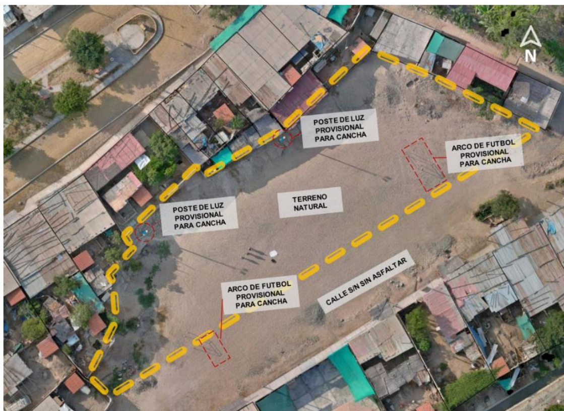
Figura N° 5: Ubicación COMPLEJO DEPORTIVO SAN JORGE