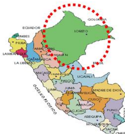
Provincia de Requena