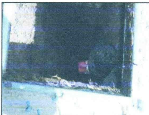
ILUSTRACIÓN 07: VÁLVULAS DE AIRE -1

Las 17 válvulas de aire existentes se encuentran en mal estado de conservación, muchas de ellas ni siquiera se encontraron en sus cajas correspondientes.