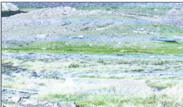
ILUSTRACIÓN 02: ESTRUCTURA DE LA CAPTACIÓN "MISA PUQUIO"

La estructura de captación se encuentra en regular estado de conservación; sin embargo, las instalaciones hidráulicas se encuentran en malas condiciones, lo que no permite captar de forma óptima el agua proveniente del manantial Misa Puquio.