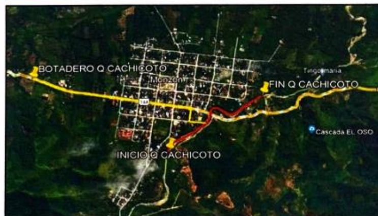
Captura satelital del Área de Intervención

Jr. Huánuco N° 310 Llata - Huamalies - Huánuco