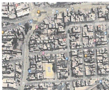
Imagen N°01: Ubicación del Proyecto