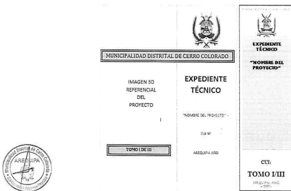
Figura 1. Forma de presentación del Expediente

Los expedientes deberán ser presentados en archivadores de palanca de lomo ancho. Cada archivador deberá considerar una carátula en la parte frontal y en lomo del mismo, para una rápida verificación. Se recomienda que dichas carátulas, deberán indicar como mínimo, lo indicado en la figura 1.