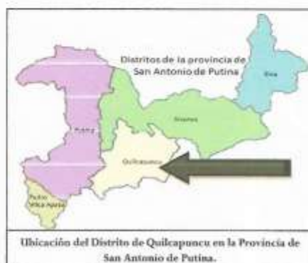
Gráfico N° 03: Localización de las Comunidades del Distrito de Quilcapuncu - COMBUCO