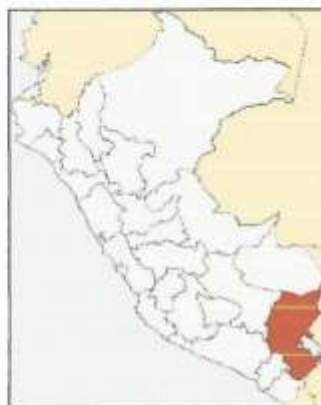
Ubicación del Departamento de Puno en el Perú