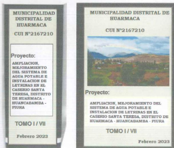
Figura 1. Forma de presentación del Expedient

El contenido máximo de folios por cada archivador será de 200 páginas, salvo cuando el límite obligará a dividir escritos o documentos que constituyan un solo requisito, en cuyo caso se mantendrá su unidad. Por ejemplo, un solo requisito puede ser el Estudio de Mecánica de Suelos, o el Manual de Operación y Mantenimiento. En esos casos, estos documentos no deberán ser divididos en diferentes tomos, deben mantenerse en uno solo.