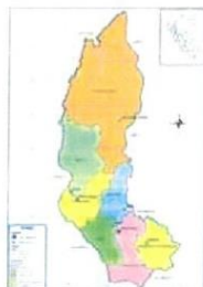
DEPARTAMENTO DE AMAZONAS