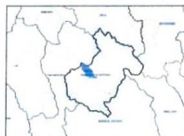
DISTRITO DE LONGAR