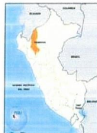
MAPA POLÍTICO DEL PERÚ