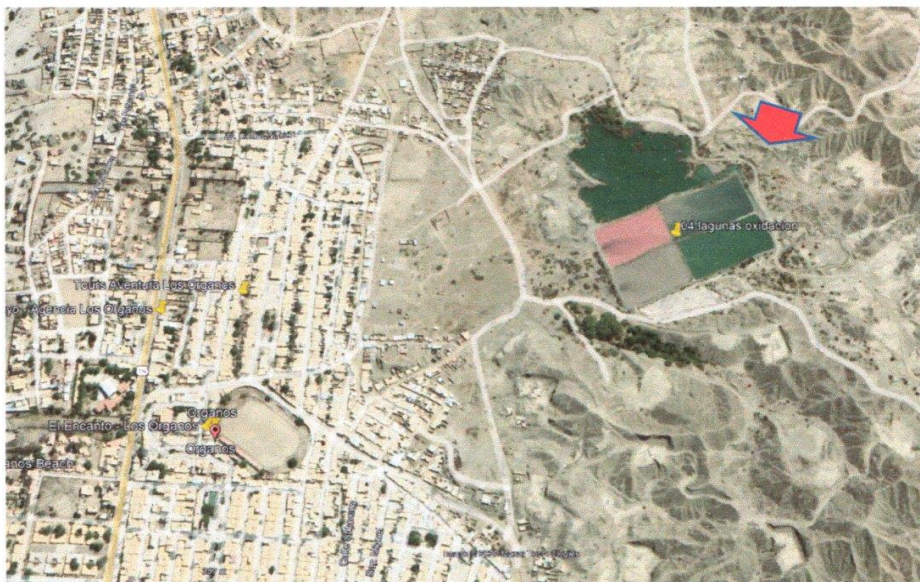
Ilustración 2. Ubicación de 04 lagunas al sur este de la ciudad de los Organos.

MUNICIPALIDAD DISTRITAL DE LOS ORGANOS GERENCIA DE INFRAESTRUCTURA Y DESARROLLO URBANO