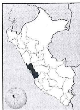
UBICACIÓN GEOGRÁFICA DEL DEPARTAMENTO DE LIMA

Región : Lima Departamento : Lima Provincia : Lima Distrito : Lince