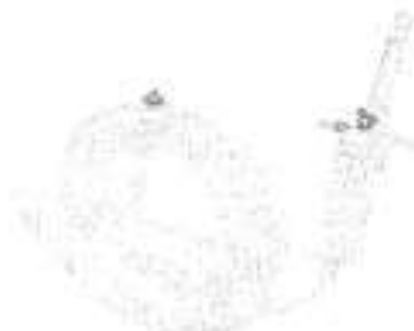
Fig. 1 (No incluye diseño)